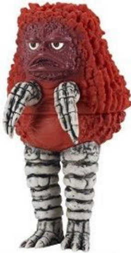
画像にマウスを合わせると拡大されます

初心者のあなたへ店舗せどりで、とりあえず全頭検査正直しんどいですよね(;^ω^) そこで今回特別に通常棚に吊ってある〇〇〇〇のどこ見るだけで アホみたい簡単にウマウマごっちゃん利益を見つける方法 大・公・開！